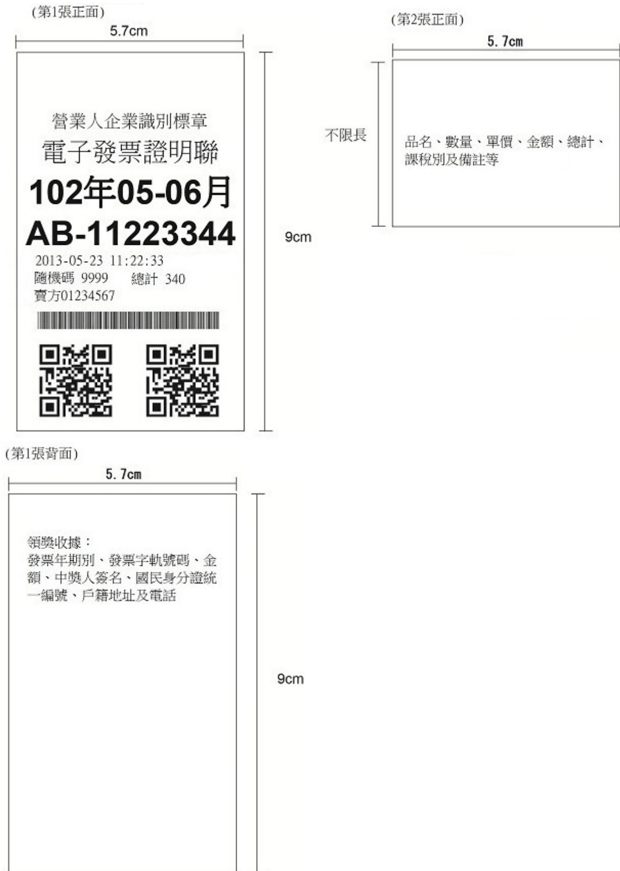
圖 1-1 買受人為非營業人之格式(範例)