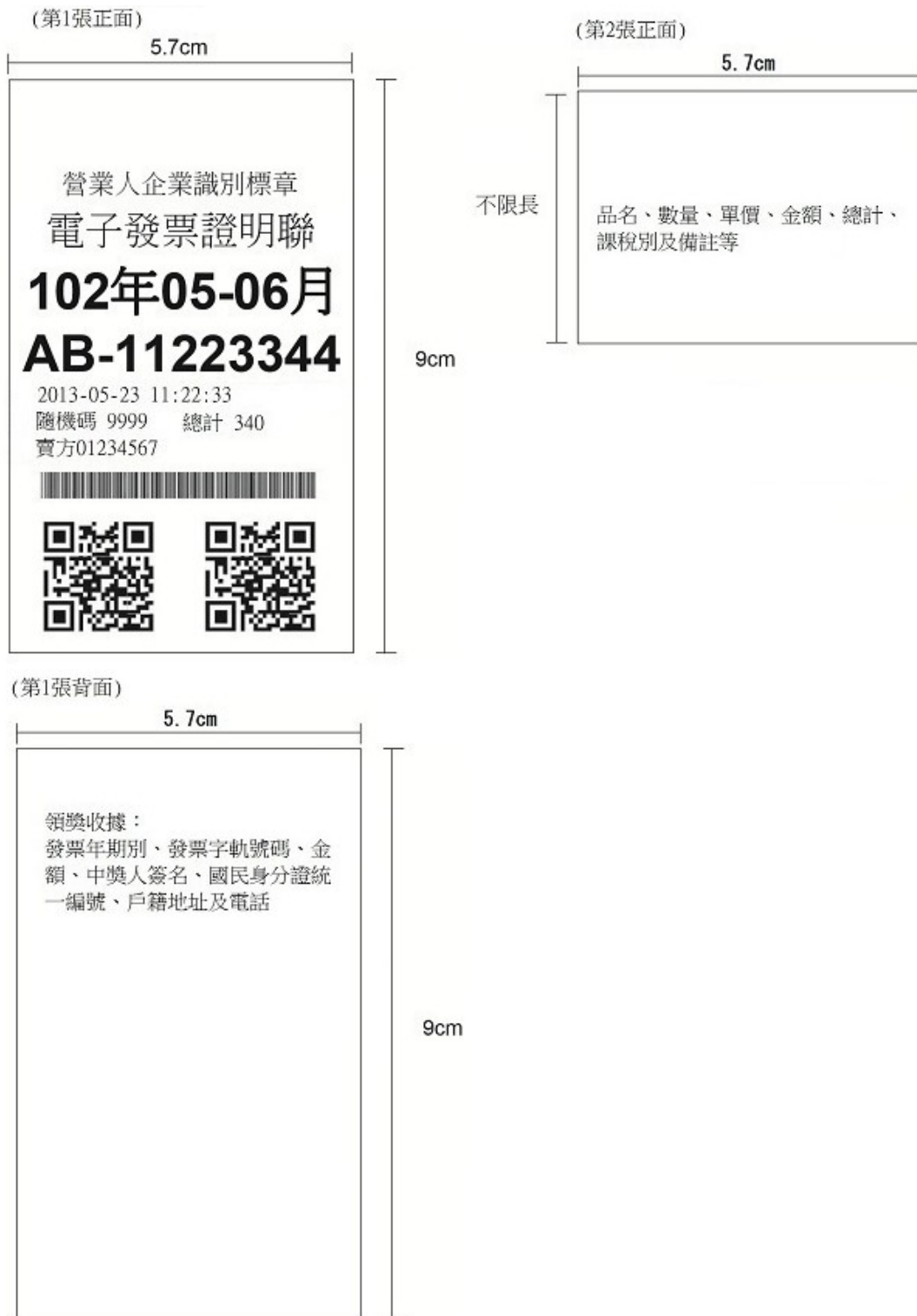
圖 1-1 買受人為非營業人之格式(範例)